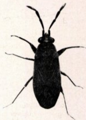
Peritrechus angusticollis ♀ vergr. 8 ×.

tenland is het zeer zeldzaam en ik vermoed, dat het nog lang bij ons een unicum blijven zal.