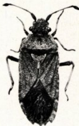
Bathysolen nubilus ♀ vergr. 7 ×.

Eveneens een wijfje van Peritrechus angusticollis (Shlb.) werd door Rector Cremers in het Schinvelder veenmos van 24. 12. 34. gevonden (cfr. 24ste Jaargang van dit Tijdschrift: afl. 1. p. 8). Het diertje kan verwisseld worden met een klein (4 mm) exemplaar van Peritrechus geniculatus (Hhn), doch heeft zeer dikke, knotsvormige sprietleden en een breeden roodbruinen band aan het proximale gedeelte der dijen. Ook in het bui-